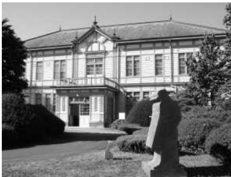
岩手大学農学部附属農業教育資料館 (重要文化財：旧制盛岡高等農林学校本館)